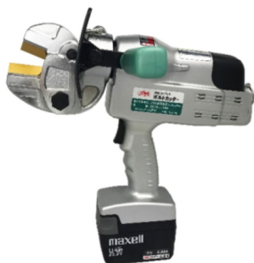
電気装置及び油圧装置を備えたボルトクリッパー