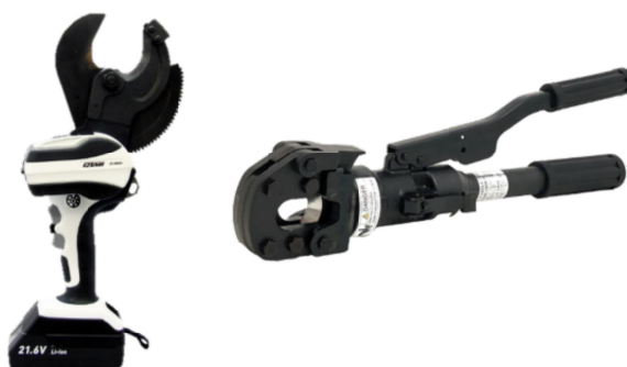
(左) 電気装置を備えたケーブルカッター