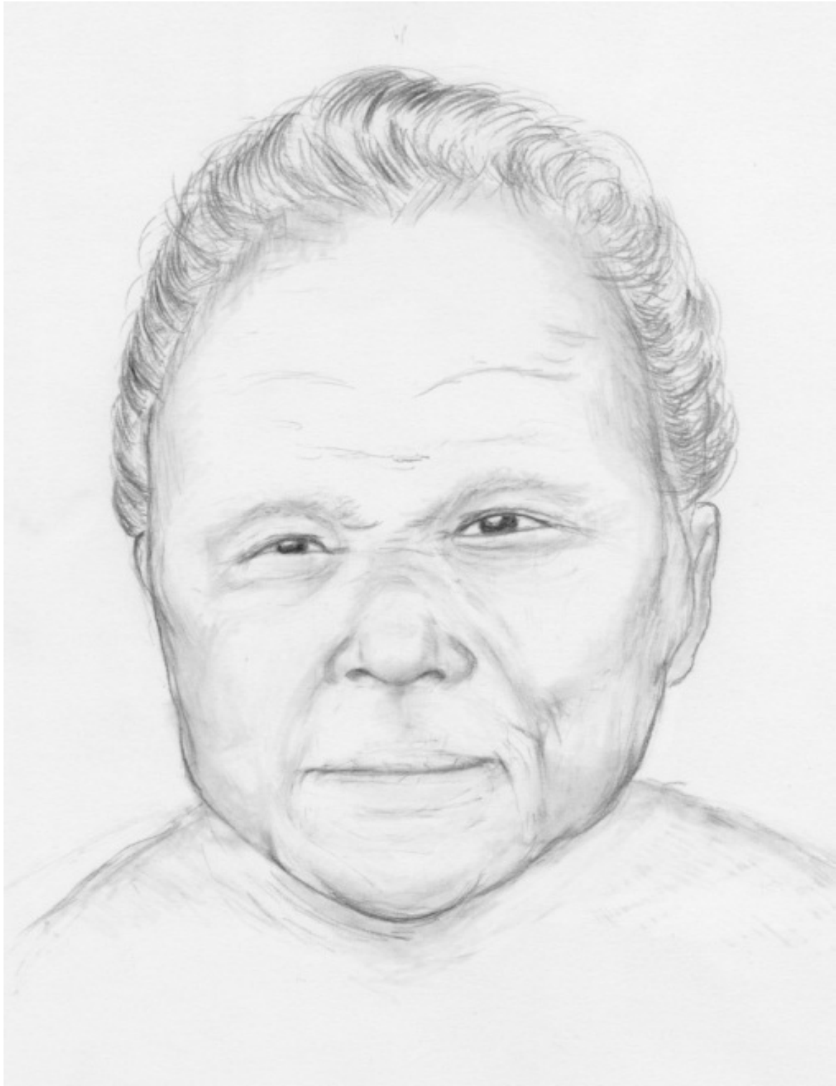
似顔絵番号 5 (似顔絵 6 と同一人物)