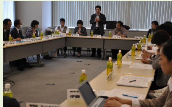
《在宅ケアワーキング委員会の様子》

平成 24 年度には「チームかまいし」が発足し、情報交換を通じ盛岡～釜石のネットワークも強固なものになっています。チームもりおかでは、今後、全県的に「チーム〇〇」が立ち上がり、岩手県を支える在宅医療のネットワークづくりが出来るように取組を進めていきます。