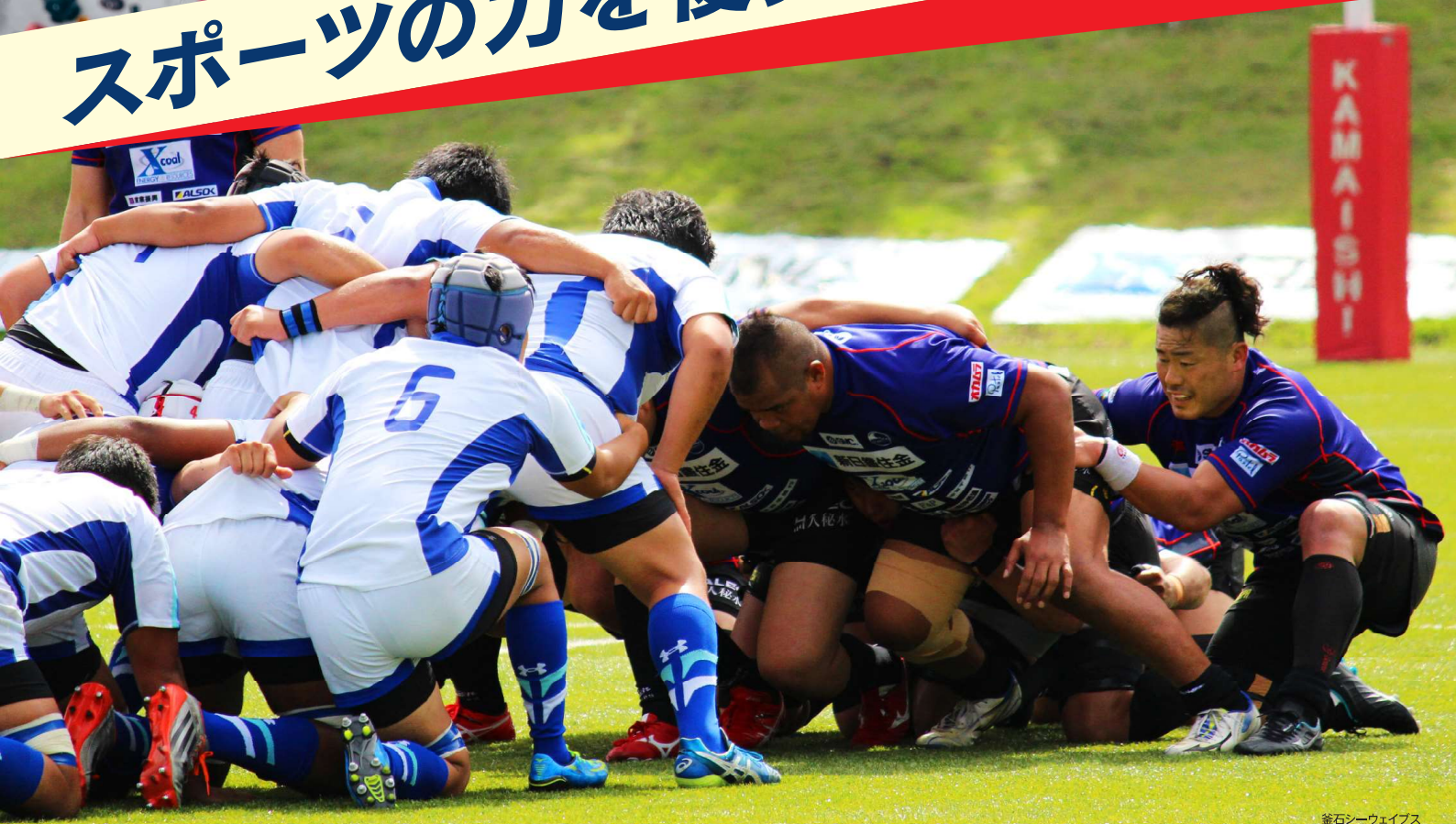
釜石シーウェイブス