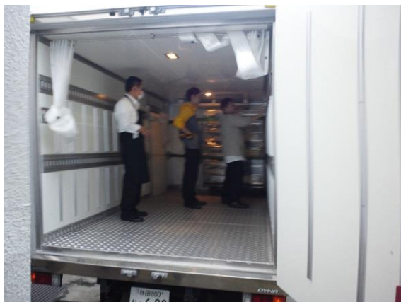
ケータリング管理(おんどとりでの測定)

施設・設備の管理状況、従事者の健康状態、器具等の洗 浄・消毒状況、運搬に係る温度管理、原材料の保管及び 食品等の取扱い状況確認を実施