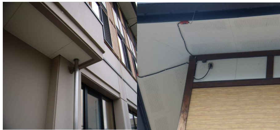
鳥や蜂の巣の撤去