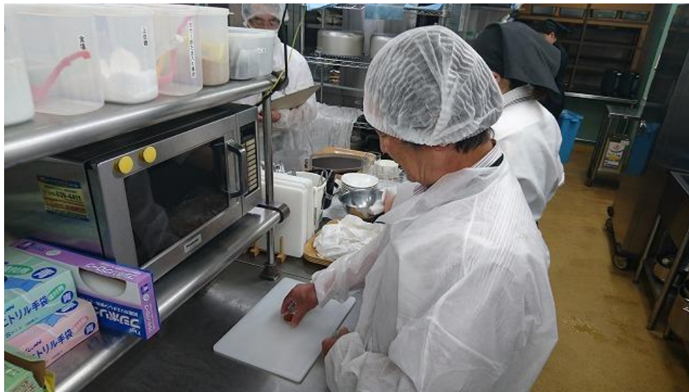
フードスタンプ検査