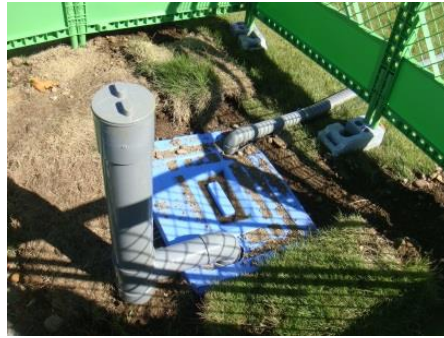
水道接続状況確認