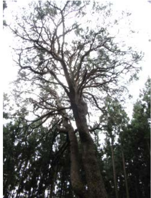
写真2 「からかさ松」樹上