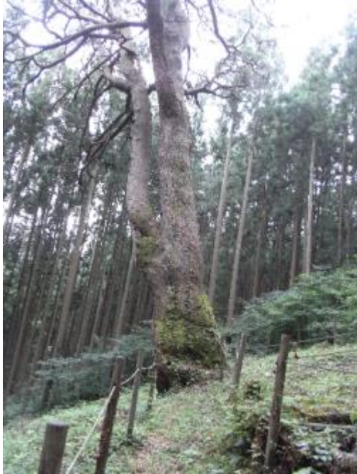
写真1 「からかさ松」とよく整備された散策路