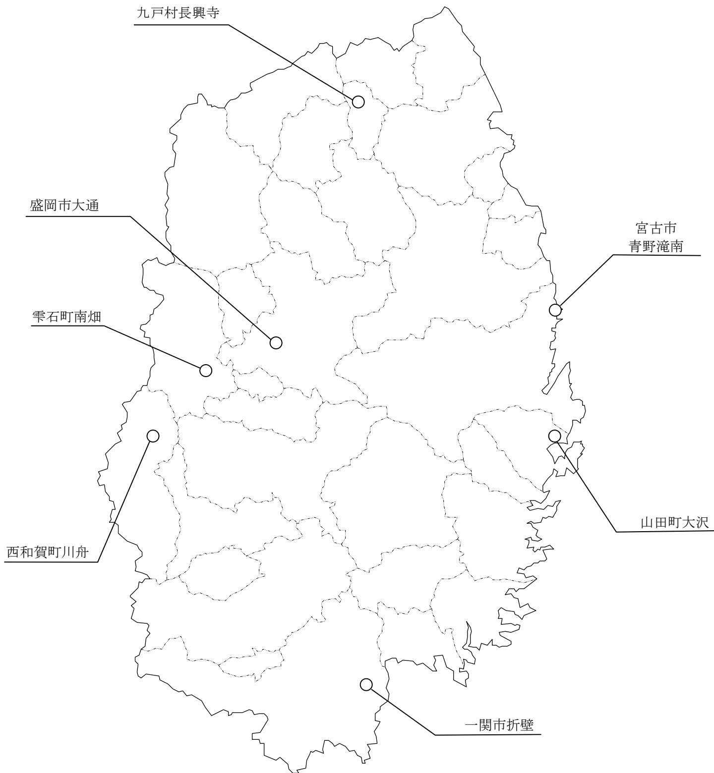
図3 平成26年度ダイオキシン類（地下水）モニタリング調査地点