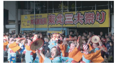
郷土芸能などで賑わいをみせる会場

17 日の本祭には、東北地方を代表する秋田県秋田市の「竿燈」、岩手県盛岡市の「さんさ踊り」、山形県山形市の「花笠踊り」、宮城県仙台市の「すずめ踊り」に加え、三陸沿岸被災地の郷土芸能である「虎舞」・「鹿子踊」が参加。また、韓国の伝統芸能である農楽の「トブロン農楽団」も加わり、約 400 人が商店街を練り歩き、会場は華やかな雰囲気になりました。