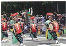
【盛岡さんさ踊り振興協議会】 岩手の夏の風物詩 世界一の太鼓ハレード