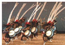
【花巻農業高等学校 鹿踊部】 宮澤賢治もよく愛した 「郷土芸能」