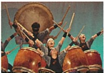
【松川一の宮太鼓の会】 結成30年 八幡平市の創作太鼓