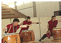
【二戸大作太鼓保存会】 みちのくの「忠臣蔵」 相馬大作の精神を受け継ぐ