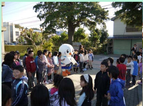
あいさつ運動をする様子(東京都)