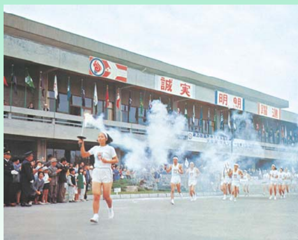
県内63市町村を 13,000人がつないだ 炬火リレー