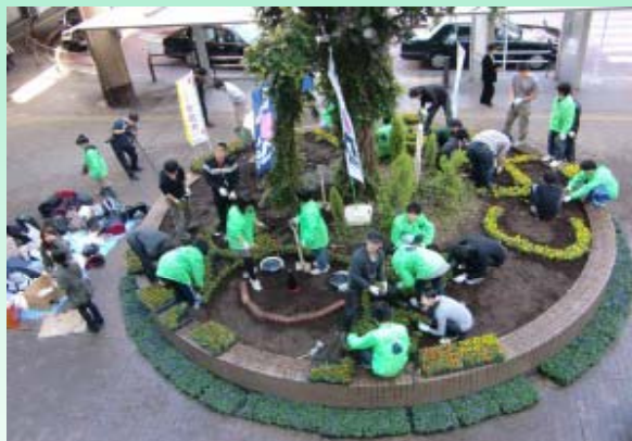
花壇作りをする様子(千葉県)