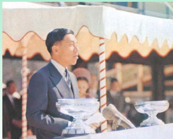
お言葉を述べられる 皇太子殿下 (現天皇陛下)