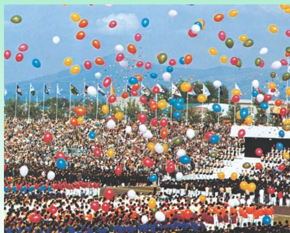
開会式の上空を彩る 10,000個の風船