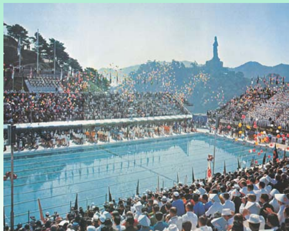
夏季大会開会式の様子 (釜石市営プール)