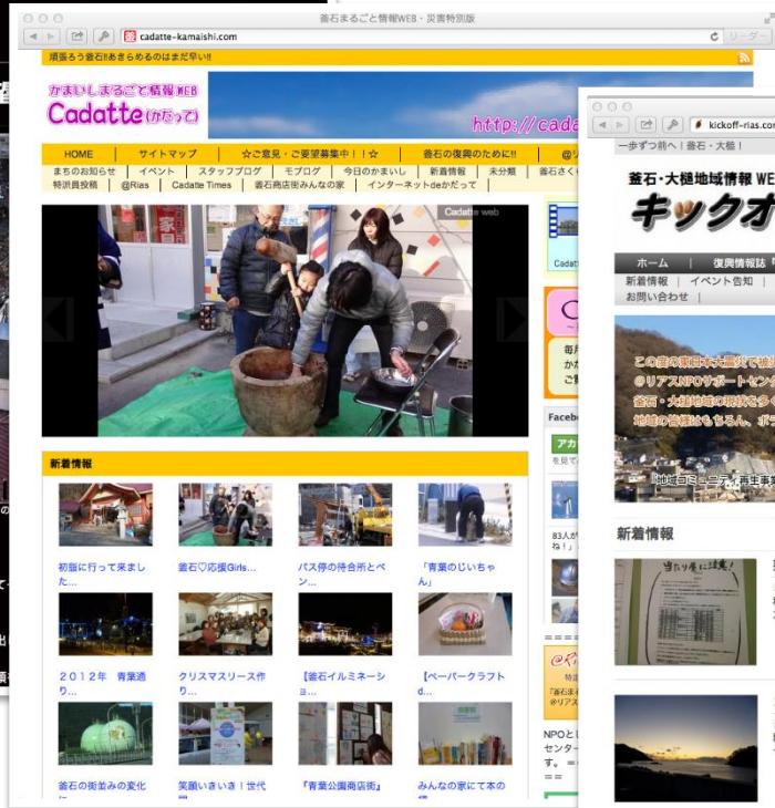
釜石まるごと情報WEB Cadatte