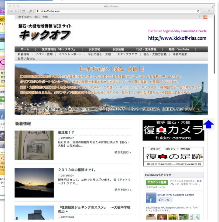
釜石・大槌情報WEB キックオフ