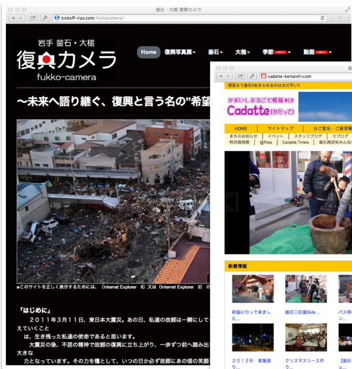
岩手 釜石・大槌 復興カメラ