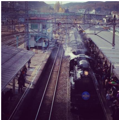
一ノ関駅で出発を待つ「SLがんばろう岩手号」

乗客や、沿線で一目見ようと駆け付けた市民やアマチュアカメラマンは、白煙を上げながらゆっくりと力強く進むSLの雄姿に、元気をもらい、復興へ向けて歩む「岩手」の姿を重ね合わせました。