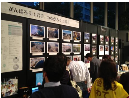
震災復興写真展の様子