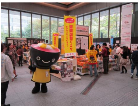
“うにっち”も物産フェア会場を盛り上げました

今回新たに、「東京から元気を！被災地復興応援フェスタ」の開催が決定！12月19日から21日まで、東京国際フォーラムにて開催されます。岩手・宮城・福島の物産販売や観光PR、ステージイベントなど、盛りだくさんの内容をご用意。また、今回も震災復興写真展を同時開催します。ご来場お待ちしております！