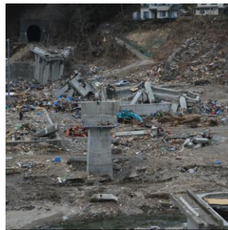
線路が流出した島越駅付近

その三鉄は津波で甚大な被害を受けました。「とにかく復旧できるところから列車を動かそう」と、震災5日後の3月16日には久慈～陸中野田間で、20日には宮古～田老間で、29日には田老～小本間で運転を再開したものの、現在の運転再開区間は全線の3分の1程度にすぎません。