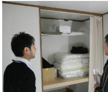
見学会の様子(参加者へ説明する職員)

応急仮設住宅の寒さ対策は、外断熱工事が10月に完了し、12月中には風除室の設置も完了するほか、地元業者を活用しファンヒーターやこたつなどの暖房器具を市町村の実情に応じて各戸に提供することとしており、被災者の住環境の改善に努めています。