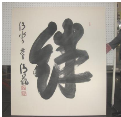
「今年の漢字」と同じサイズ(1.5m×1.3m)、同じ越前和紙を使用

11月8日、「今年の漢字」で知られる清水寺・森清範貫主による直筆の「絆」の書が県に寄贈されました。これは、「希望郷いわて文化大使」でもある森貫主が被災地復興の一助になればと自ら漢字を選び揮毫されたものです。