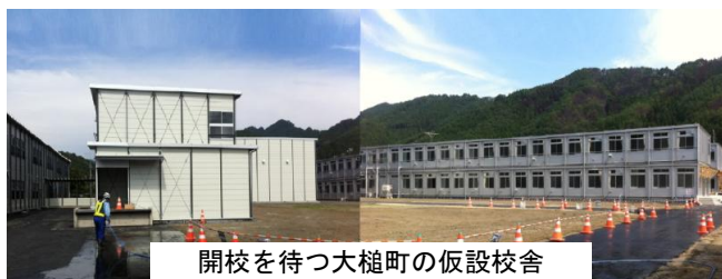
開校を待つ大槌町の仮設校舎

大槌町では、震災の被害で使えなくなった学校の仮設校舎が整備され、開校式を間近に控えています。