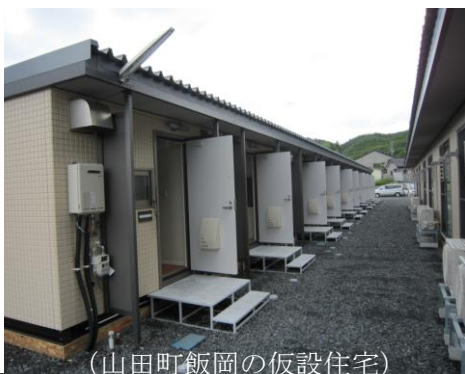
(山田町飯岡の仮設住宅)