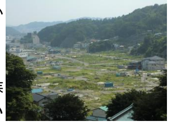
7月31日撮影 宮古市鎌ヶ崎地区

間もなく震災後二度目のお盆を迎えます。この機会に、普段は離れて暮らす家族や親戚の多くの方が帰省されることと思えます。被災地の復興が少しずつ進んでいることを感じてもらえれば幸いです。そんな岩手の今を紹介します。