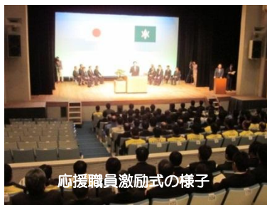
応援職員激励式の様子

両調査に関する詳細は、「いわて復興ネット」ホームページ( 「いわて復興ウォッチャー調査について」 及び 「被災事業所復興状況調査について」 )をご覧ください。