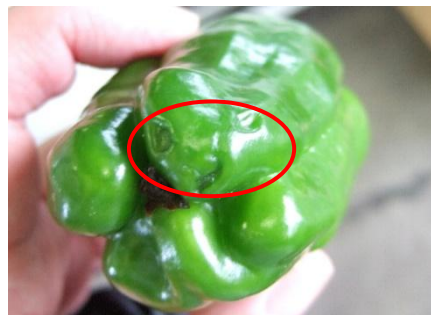
図3 尻腐果(赤丸内のくぼみ症状)の例