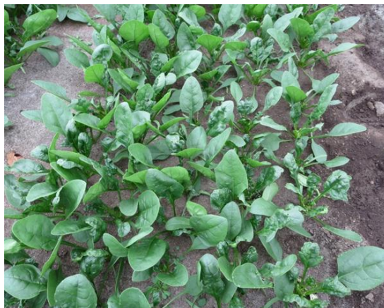
写真4 ハウレンソウケナガコナダニの被害状況（芯止まり、葉の奇形）

また、アブラムシ類の発生が見られる場合は、適用のある殺虫剤で防除します。なお、ハウレンソウケナガコナダニに適用のある殺虫剤は、アブラムシ類に効果のないものが多いので、注意が必要です。