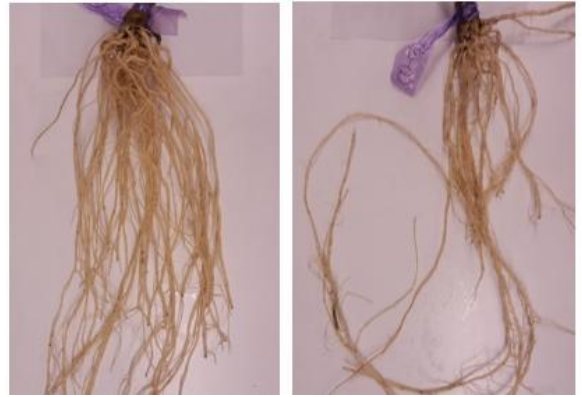
写真2 排水の違いによるきゅうりの根の状態 (左：排水良好、右：排水不良)

梅雨時期は、「黒星病」「斑点細菌病」「べと病」を重点とした薬剤を選択し、予防散布に努めます。なお、最近、一部地域で黒星病対象薬剤の耐性菌が発生している事例が見られますので、薬剤散布の効果が見られない場合は、最寄りの農業改良普及センターに相談してください。