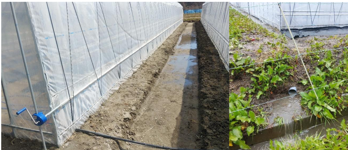
写真1 左：ハウス周囲の明きょ設置状況 右：降雨時の排水路への排水状況

例年、施設・露地ともに排水不良が原因と思われる生育不良が見受けられます。水田転作の場合は、水路等の点検整備を行い、ほ場外からの水の浸入防止に努めるとともに、降雨後の排水を促すための明きょ・排水溝の設置、高うね栽培とします。排水不良が十分改善されない場合は、耕盤破碎や補助暗きょの設置も検討してください。