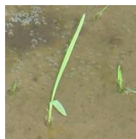
図5 ノビエ2葉期頃の個体