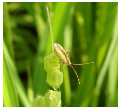
図8 アカスジカスミカメ成虫