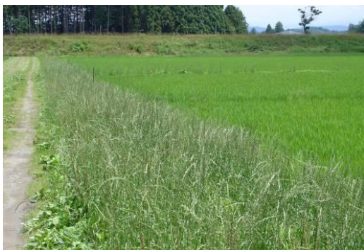
図7 畦畔に群生するイタリアンライグラス (斑点米カメムシの増殖原となる)

エ 草刈り後10日間程度は雑草の出穂を抑制できますが、その後も、イネ科植物（イタリアンライグラス、スズメノカタビラ等）を出穂させないように管理します。