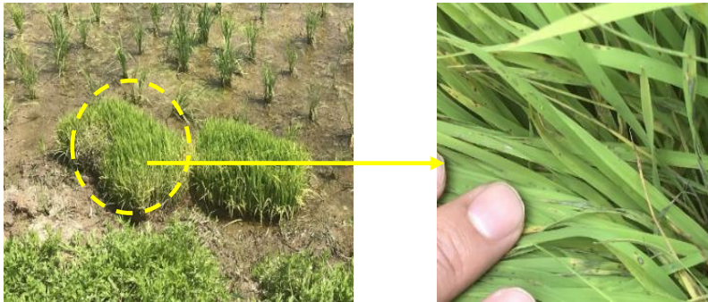
図6 取置苗での葉いもち発生

ウ 葉いもち予防水面施用粒剤を施用する前や箱施用剤を使用した場合でも、ほ場をよく観察して葉いもちの発生が見られた場合には、直ちに茎葉散布を行います。