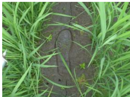
図3 中干し程度（軽く踏んで足跡がつく）