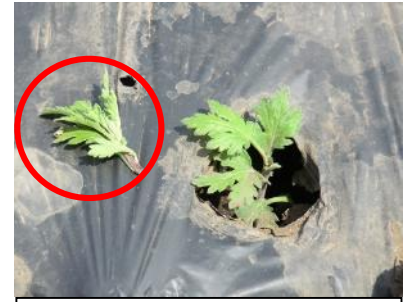
ソフトピンチの例