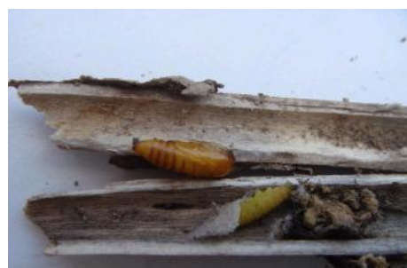
残茎内のリンドウホソハマキ越冬幼虫

また、成虫や幼虫の潜葉痕や頂部の食害が認められたら直ちに薬剤防除を開始します。発生が早い年は、県南部で5月上旬から、県中部では5月中旬から成虫の発生が始まります。