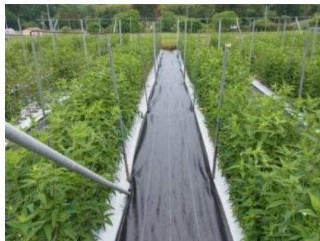
防草シートの使用例

また、防草シートを使用していない部分は、りんどうに適用のある除草剤を茎葉処理剤と土壌処理剤を区分して活用し、除草労力の軽減化を図ります。