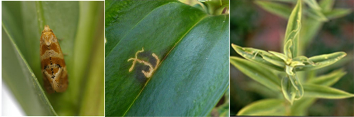
成虫（体長 5～6 mm）