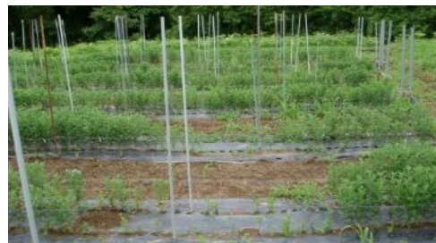
排水不良地で発生した欠株 (写真手前中央部ほど水が溜まりやすかったため、被害程度が大きい)

小ぎくは過湿による生育への影響が大きく、排水不良となりやすい水田転換畑などで栽培する場合は、明きよ、暗きよなどの排水対策を講じます。また、高畝栽培も有効です。