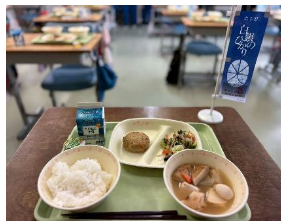
11/20 に普代村で提供された学校給食