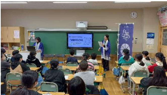
11/27 久慈市・宇部小での授業の様子

普及センターでは、引き続き「白銀のひかり」の高品質・安定生産に向けた生産者の活動支援のほか、地域の子供達の理解を深める活動を行っていきます。