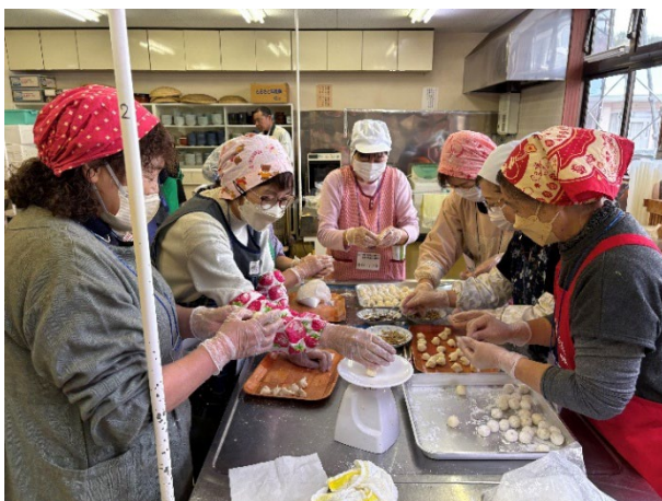
料理研修会の様子

異なる組織のメンバーとの交流により、互いの活動について知見を広げ、親睦を深める一日となりました。