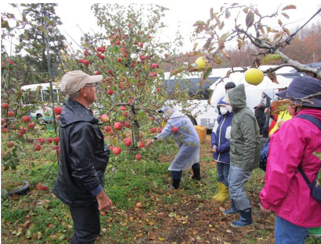
(りんご収穫作業体験)

高校生からは「今回の体験で学んだことを将来役立てたい」、一般の方からは「ふだん見られないところを知ることができて良かった」などの感想があり、今後の農業振興につながる結果となりました。