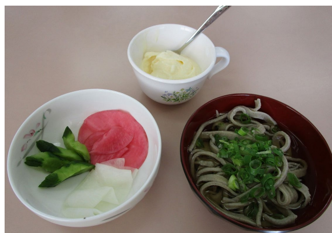
出来上がった手作りアイスクリーム、手打ちそば