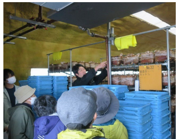
(菌床しいたけの生産現場視察)