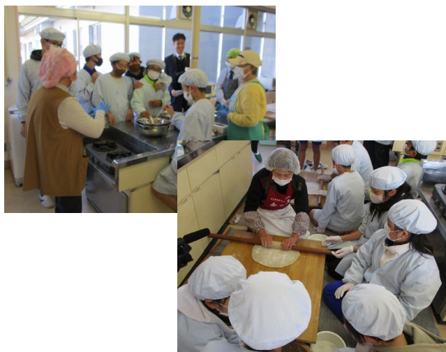
左上：アイスクリーム、中下：手打ちそばを教わる子どもたち