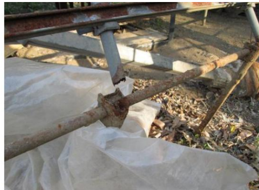
地際部の腐食による折れ