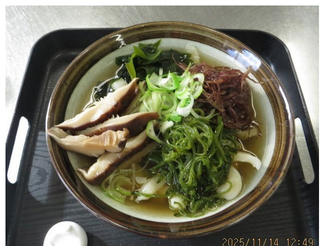
できあがった「いげばっと」