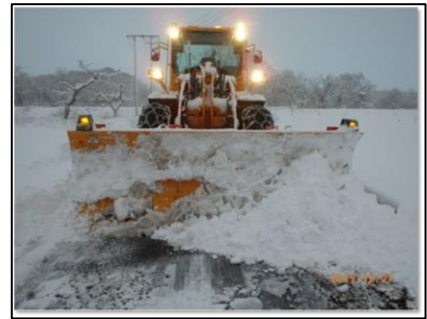
冬期間の市道除雪作業