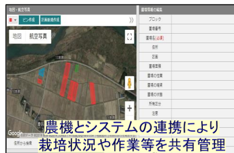
農機とシステムの連携により 栽培状況や作業等を共有管理