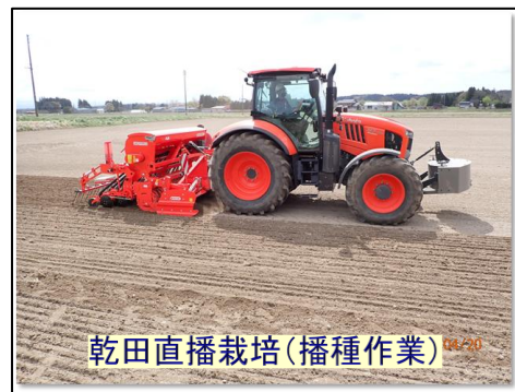
乾田直播栽培(播種作業) 4/24/20

私たちは、「地域の頼りになる公社」となること、また、職員が笑顔で働ける職場づくりをすることを念頭に置き、日々取り組んでいます。