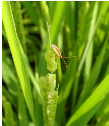
写真 出穂開花した水稲に寄生するアカスジカスミカメ