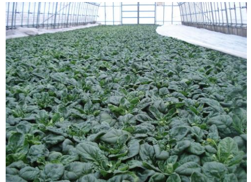
写真1 収穫直前の寒じめほうれんそう (ハウス内の温度管理が重要)