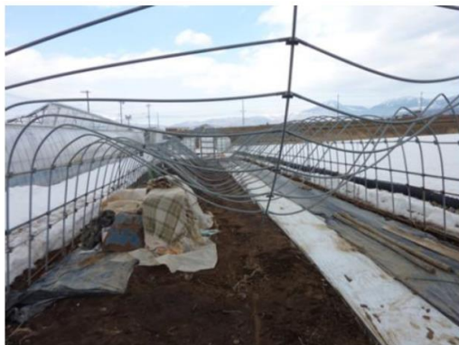
単棟パイプハウスのM字型陥没

平年並の降雪に対しては、予め柱の補強や暖房機の設定温度を上げるなどの対策で対処できますが、記録的な積雪の場合、ハウスの耐雪強度を大幅に超過するため、構造的に必要なと思われる筋交いがない、水平ばりが配置されていない等のハウスは倒壊する危険が高まります。