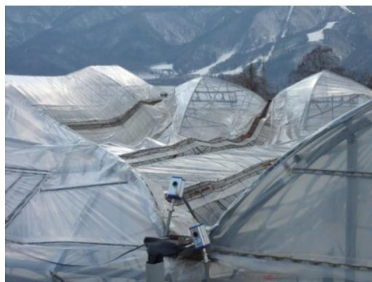
連棟パイプハウスの倒壊