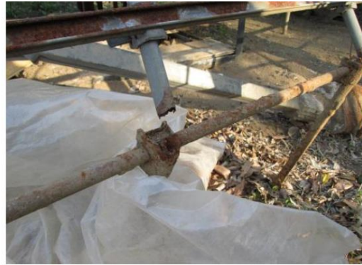
地際部の腐食による折れ