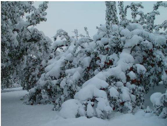
写真1 落葉前の積雪によるりんご樹への着雪

降雪前にぶどう棚を点検し、粗めのせん定により枝を短くするなどの対策を行います。また、ぶどう棚は、倒壊のおそれがある場合は棚上の雪おろしを行います。