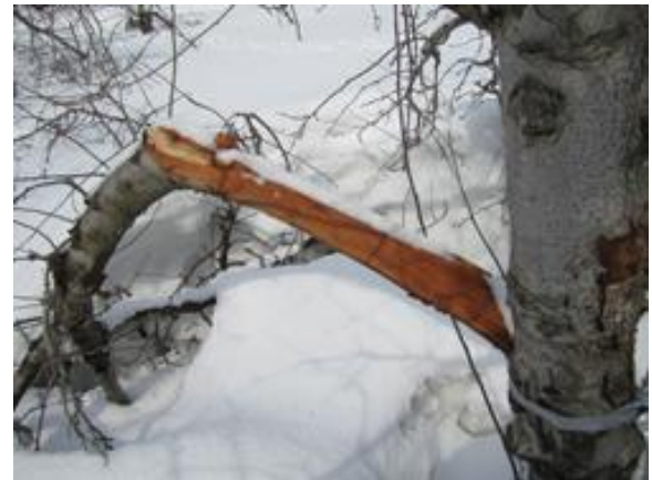
写真2 降雪による側枝の折損