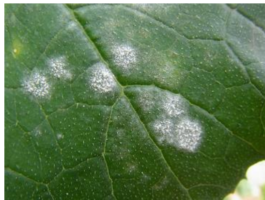
図10 うどんこ病の病斑