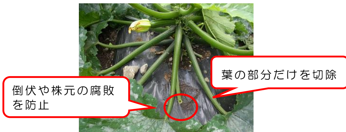
図 4 摘葉の仕方

葉柄が上向きに伸びた葉は、雨水が入りやすく、病害発生の原因となるため、摘葉は控えます。