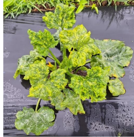
図6 ウイルス病の罹病株