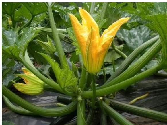
図 2 雄花の様子

早い作型では、開花時期が低温で蜂が飛ばないので、うまく着果しない場合があります。また、夏の高温（25℃以上）だと、花粉の生成量が減少し、不稔になることが多いです。その場合は、人工授粉を行うことで、奇形果の発生を抑えられます。