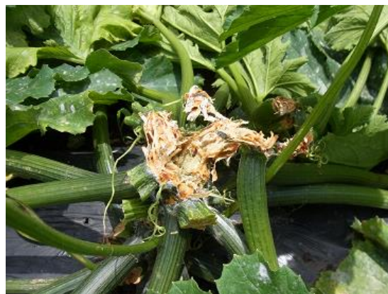
図9 軟腐細菌病により腐敗した罹病株

梅雨前の定期的な防除の徹底と圃場排水・草勢維持に努めましょう。また、罹病株は速やかに抜き取り、ほ場外へ持ち出し処分 しましょう。