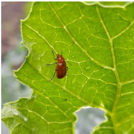
図7 ウリハムシの成虫