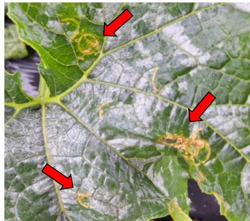
図8 ウリハムシによる葉への食害