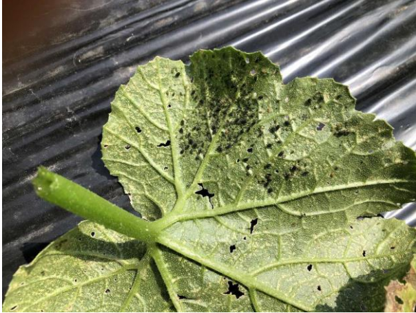
図5 葉裏に寄生したアブラムシ

防除暦を参考にして、 生育初期から防除 を実施しましょう。また、ウイルス病の発病株は、直ちに除去、処分して、他株への感染拡大を防ぎましょう。