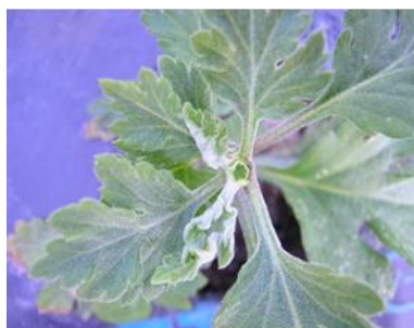
ソフトピンチの例