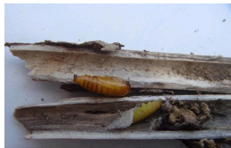
残茎内のリンドウホソハマキ越冬幼虫

特に、前年にハダニ類が発生した圃場では、残茎の中などで越冬した成虫の数が多くなるため、本年も発生しやすくなります。葉裏をよく観察して発生状況を確認し、発生初期に薬剤防除を行います。ダニ剤は、同系薬剤の使用を年一回とし、散布ムラがないよう葉の表裏に十分量を散布します。