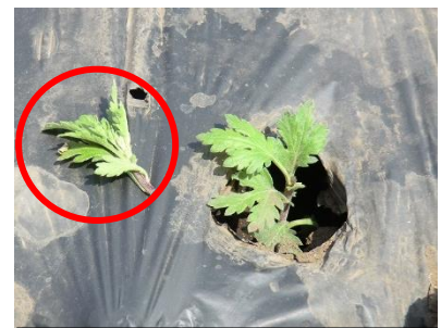
ハードピンチの例