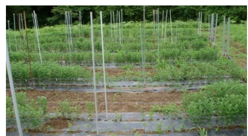
排水不良地で発生した欠株 (写真手前中央部ほど水が溜まりやすかったため、被害程度が大きい)

小ぎくは過湿による生育への影響が大きく、排水不良となりやすい水田転換畑などで栽培する場合は、明きよ、暗きよなどの排水対策を講じます。また、高畦栽培も有効です。