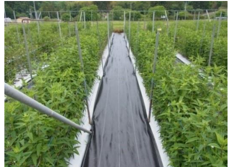
防草シートの使用例

また、防草シートを使用していない部分は、りんどうに適用のある除草剤を、茎葉処理剤と土壌処理剤を区分して活用し、除草労力の軽減化を図ります。