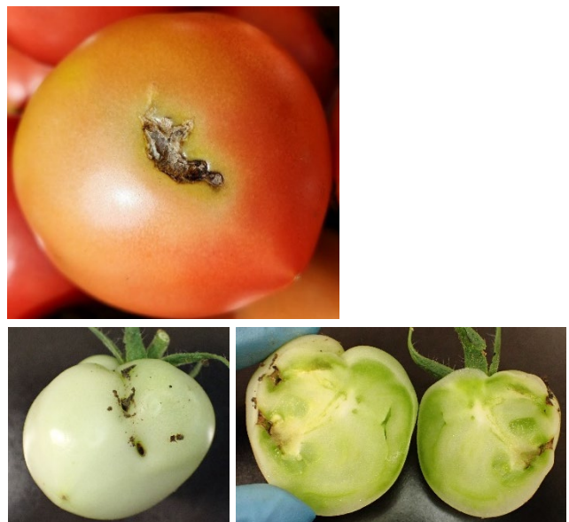
図5 トマト果実の食害痕（上：果実表面の食害痕、 下：食害果外観（左）と内部（右）