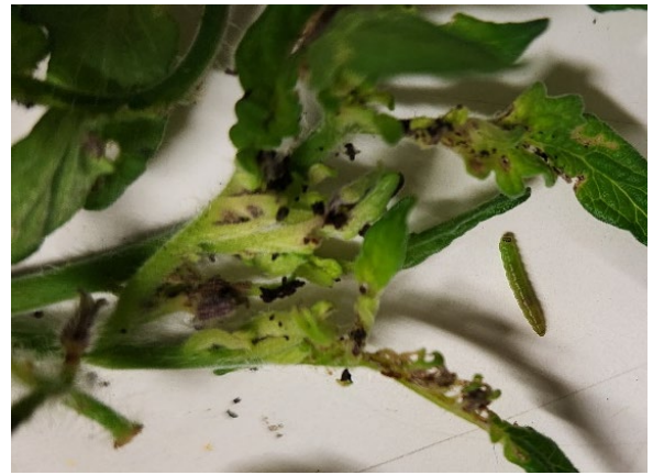
図3 生長点付近の食害状況と幼虫