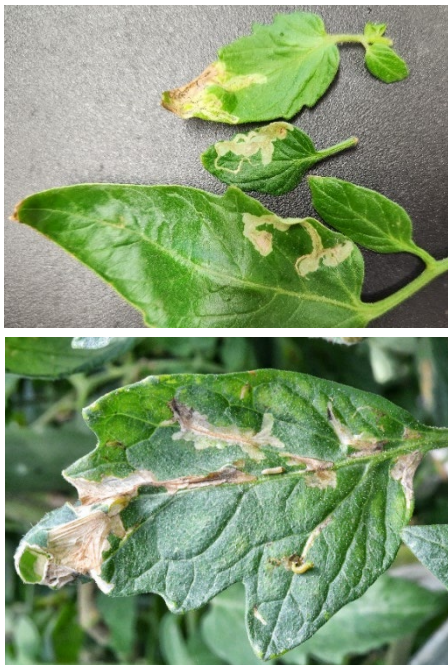
図4 ハモグリバエ類による潜葉痕（上）と トマトキバガによる潜葉痕（下）