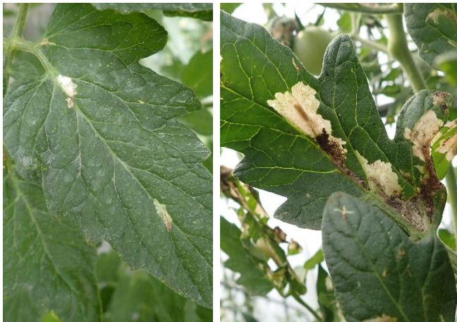
図2 葉の潜葉痕（左：初期、右：進行）