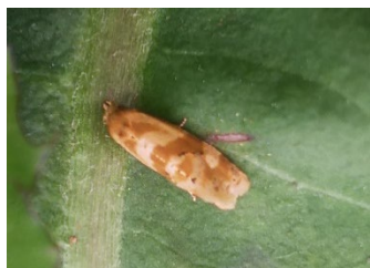
図1 りんどうホソハマキ成虫