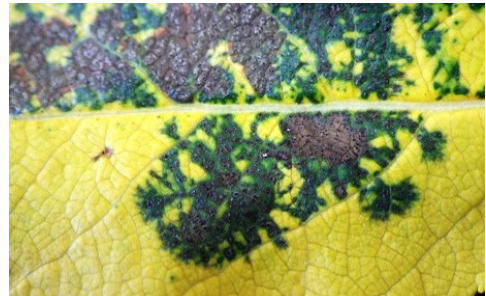
図3 褐斑病の病斑（黒色虫糞状の粒々が特徴）