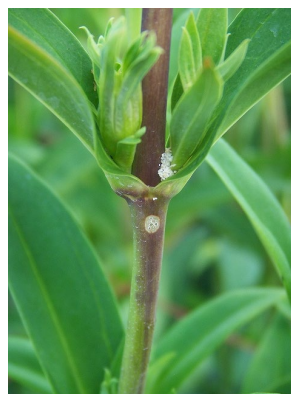
図2 被害茎の着色と羽化孔