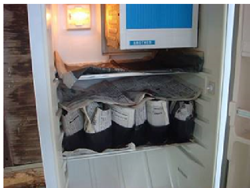
図6 家庭用冷蔵庫を利用した穂冷蔵