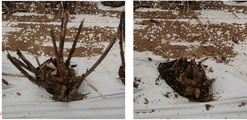
図3 残茎の除去（左：除去前、右、除去後）