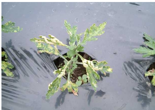
図7 定植直後の白さび病発生の様子 ※挿し穂からの病気持ち込みによる

また、害虫ではアブラムシ類とハモグリバエ類に注意します。親株からの持ち込みにより、育苗期に発生がみられることもあります。発生初期に薬剤を散布するとともに、採穂時に親株をよく観察し、健全な穂を選びます。