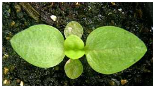
図4 薬剤防除開始時期（本葉2対葉の出始め） ※子葉に苗腐敗症発生

育苗期に発生するアルタナリア菌による苗腐敗症は、種皮に付着した病原菌が伝染源となり、子葉で発病した後、本葉に伝染します。適用殺菌剤による種子消毒に加えて、本葉2対葉目が出始める時期に薬剤散布することで、以降の病勢進展を抑制します（図4）。