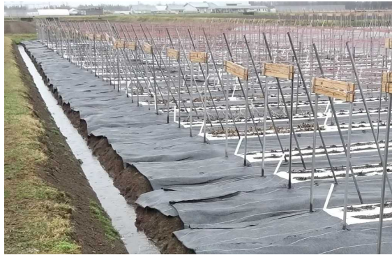
図5 畦畔内周の明きよ

また、りんどうこぶ症の発生が多い地域や前作で発生がみられた圃場では、発生のリスクを減らすため、畦畔の内周に明きよを設置するようにします。