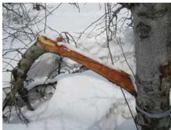
写真2 降雪による側枝の折損