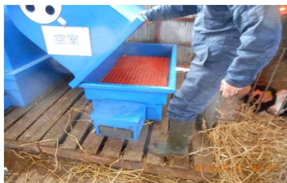
写真1、2 カーフウォーマー