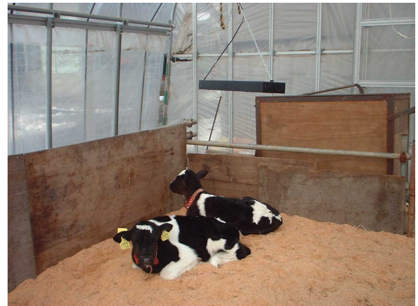
写真4 カーボンヒーターの設置