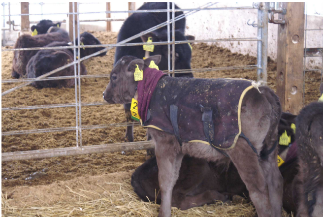
写真3 カーフジャケットとネックウォーマーの着用