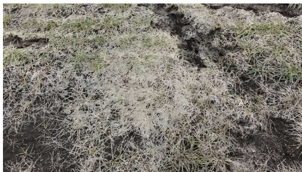
写真1 雪腐褐色小粒菌核病の被害圃場

農作物病虫害発生予察情報第7号（令和5年10月27日発行）によると、雪腐病の発生量は「並」と予想されています。県北部や高標高地帯など、根雪期間が長い地域や、耐雪性が「やや弱」の「銀河のちから」では被害が出やすいので、雪腐病防除を行ってください。雪腐病の防除時期は根雪前が最も有効とされていますが、根雪になる時期は年によって変動が大きいため、散布時期を逃さないよう注意が必要です。薬剤等の情報は農作物技術情報第8号（令和5年10月26日発行）に掲載しておりますのでご覧ください。