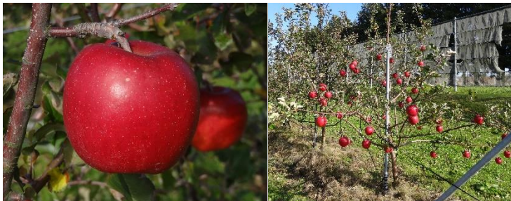
図1 「岩手15号」の果実(左)と樹姿(右)

※1 調査は、令和2～4年の樹体および果実を総合的に判断し、「育成系統適応性検定試験・特性検定試験調査方法(農水省果樹試)」により総合的に評価した ※2 果皮色は、日本園芸植物標準色票による