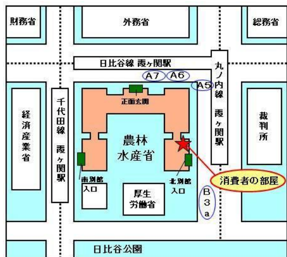
消費者の部屋 （農林水産省北別館1階）