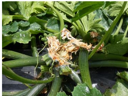
図7 腐敗した罹病株

雨によって圃場に広がり、傷口や害虫の食害痕から植物体に侵入し、被害が発生します。