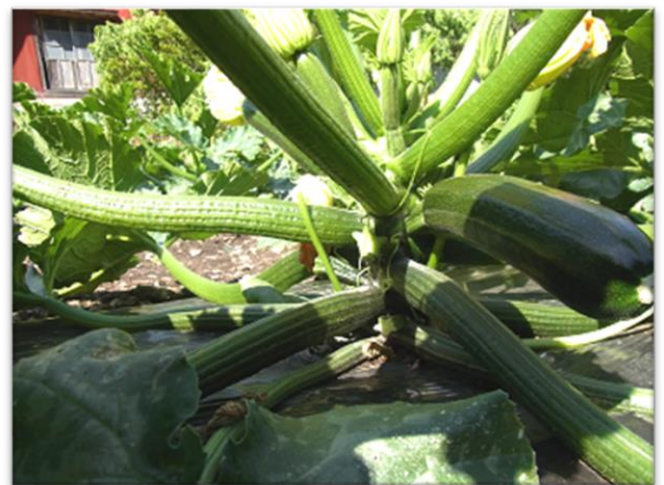
図 1 わき芽かきの仕方