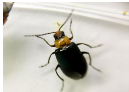
図6 ウリハムシモドキの成虫