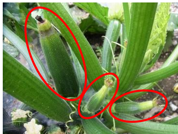
図3 着果不良の果実