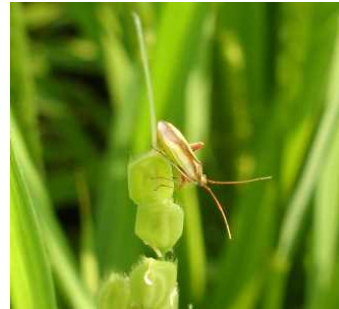
図8 アカスジカスミカメ成虫