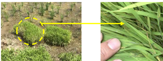
図6 取置苗での葉いもち発生

ウ 葉いもち予防水面施用粒剤を施用する前や箱施用剤を使用した場合でも、圃場をよく観察して葉いもちの発生が見られた場合には、直ちに茎葉散布を行います。