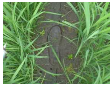
図3 中干し程度（軽く踏んで足跡がつく）