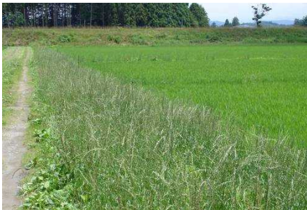
図7 畦畔に群生するイタリアンライグラス (斑点米カメムシの増殖原となる)

エ 草刈り後10日間程度は雑草の出穂を抑制できますが、その後も、イネ科植物（イタリアンライグラス、スズメノカタビラ等）を出穂させないように管理します。