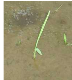
図5 ノビエ2葉期頃の個体