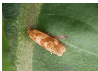
図1 りんどうホソハマキ成虫