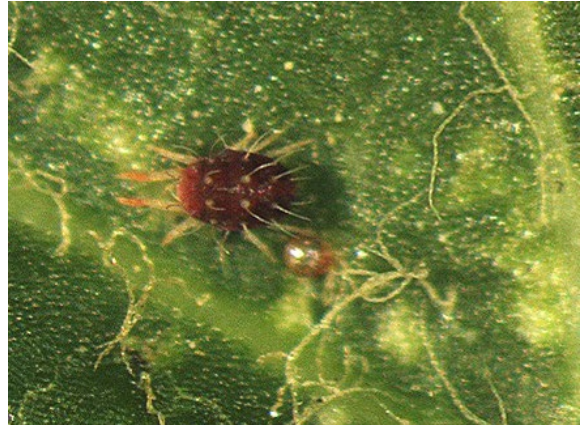
写真2 リンゴハダニ