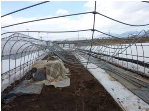
単棟パイプハウスのM字型陥没

平年並みの降雪に対しては、予め柱の補強や暖房機の設定温度を上げるなどの対策で対処が可能ですが、記録的な積雪の場合、ハウスの耐雪強度を大幅に超過するため、構造的に必要なと思われる筋交いが無い、水平ばりが配置されていない等のハウスは倒壊する危険が高まります。