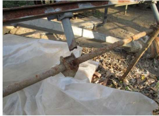
地際部の腐食による折れ