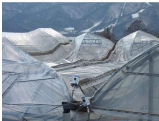
連棟パイプハウスの倒壊