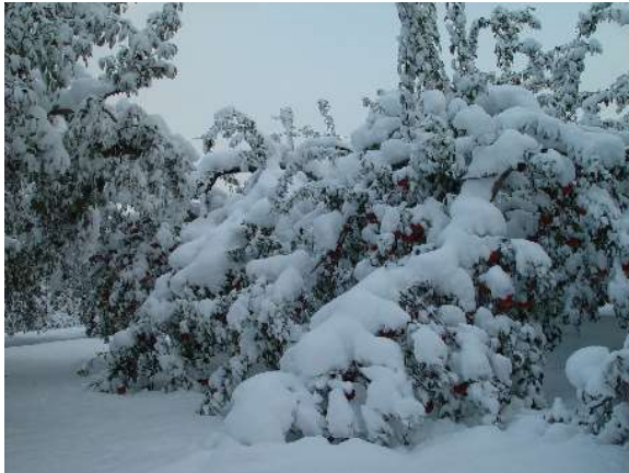
写真1 落葉前の積雪によるりんご樹への着雪

降雪前にぶどう棚を点検し、粗めのせん定により枝を短くするなどの対策を行います。また、ぶどう棚は、倒壊のおそれがある場合は棚上の雪おろしを行います。