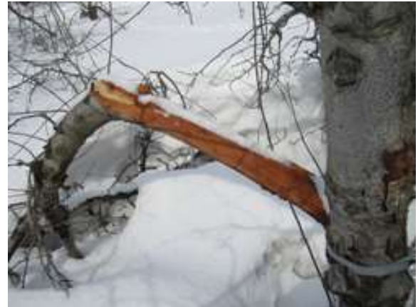
写真2 降雪による側枝の折損