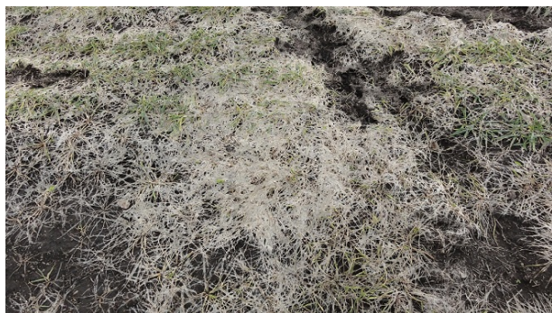
写真1 雪腐褐色小粒菌核病の被害圃場

農作物病害虫発生予察情報第7号（令和4年10月26日発行）によると、雪腐病の発生量は「並」と予想されています。県北部や高標高地帯など、根雪期間が長い地域や、耐雪性が「やや弱」の「銀河のちから」では被害が出やすいので、雪腐病防除を行ってください。雪腐病の防除時期は根雪前が最も有効とされていますが、根雪になる時期は年によって変動が大きいので、散布時期を逃さないよう注意が必要です。薬剤等の情報は農作物技術情報第8号（令和4年10月27日発行）に掲載しておりますのでご覧ください。