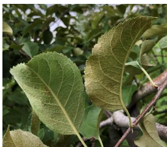
図1 ハダニ類の被害葉