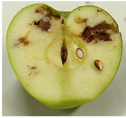
図5 シンクイムシ類の被害果（内部）