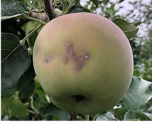
図4 シンクイムシ類の被害果（外観）