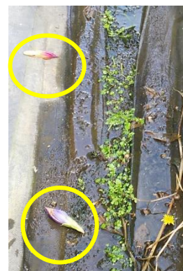
図1 花腐菌核病の多発圃場の状況 図2 通路に落ちた花蕾（翌年の発生源）