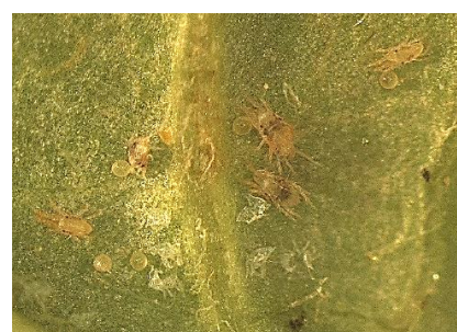
図3 ナミハダニの成虫、卵