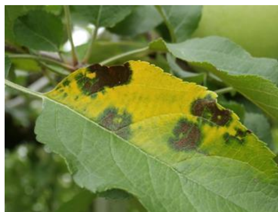
図1 褐斑病の病斑（黒色虫糞状の粒々が特徴）