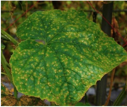
図1 褐斑病の病斑（葉）