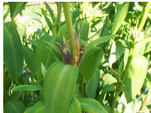
図4 リンドウホソハマキによる 花蕾被害部の着色

※ 蛹は羽化孔周辺に存在する。品種により 差があるが、髓部を食害された部分の茎 が赤くなる場合が多い。