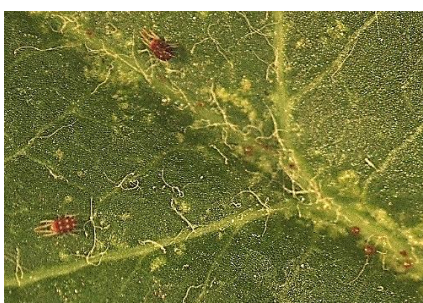
図2 リンゴハダニの成虫、卵