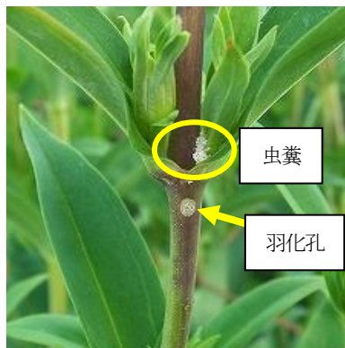
図3 茎に形成された羽化孔と 茎食入部の虫糞

※ 蛹は羽化孔周辺に存在する。品種により 差があるが、髓部を食害された部分の茎 が赤くなる場合が多い。