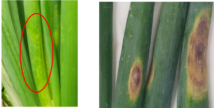
図1 葉枯病の病斑 (左：黄色斑紋病斑、 右：褐色斑点病斑)

(1) 秋冬ねぎでは、黄色斑紋病斑（図1左）の発生が9月頃から増加するため、9月上旬～10月上旬までは10日間隔で効果の高い薬剤（テーク水和剤、アミスター20フロアブル、ダコニール1000）を輪番で4回散布する。