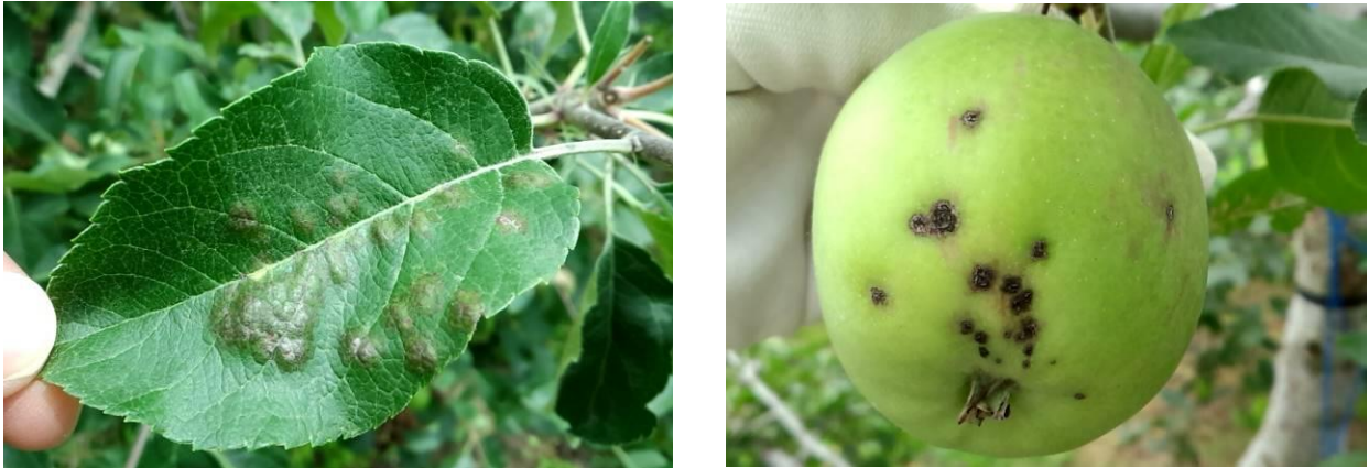
図2 黒星病の病斑（左：葉表の病斑、右：果実病斑）