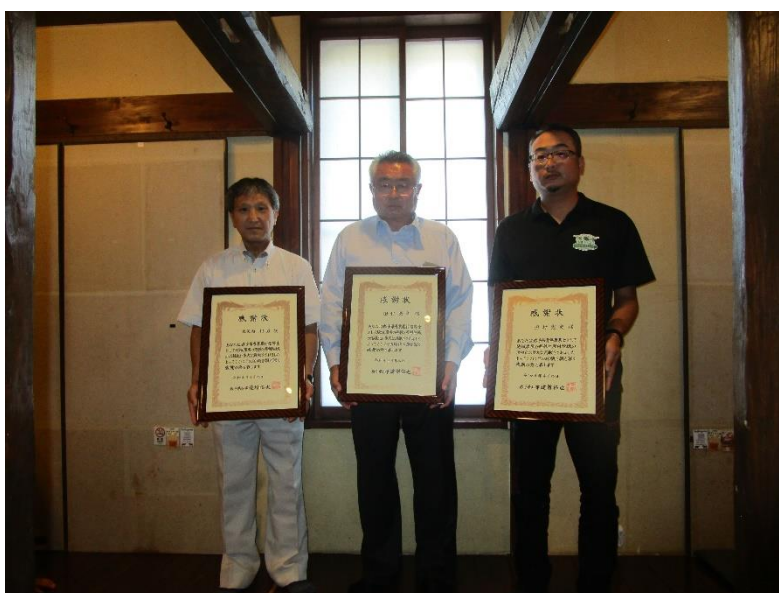
岩手県農業農村指導士の認定期間を満了された御三方

普及センターでは、今後も農業農村指導士及び青年農業士と連携を図りながら、久慈地域の農業振興と農村の活性化に取り組んでいきたいと思っております。