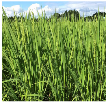
写真2 穂揃期（ひとめぼれ）※8～9割の茎で出穂、穂首はまだ完全抽出していない