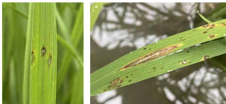
写真 3 葉いもち病斑（左：急性型、右：慢性型）