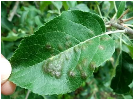
図3 隆起した葉表の病斑