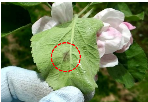
図1 果叢葉の葉裏病斑