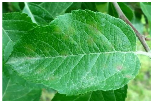
図2 葉表の初期病斑