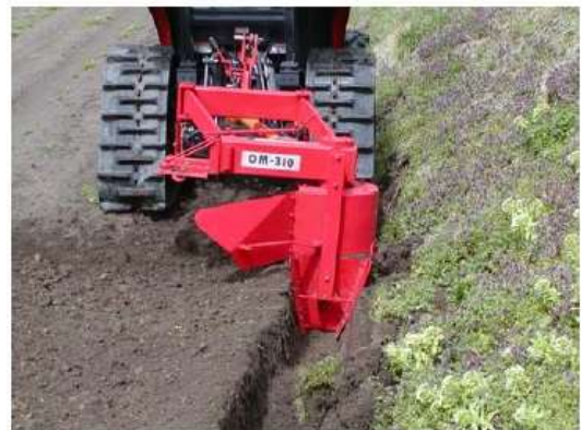
写真2 溝堀機による明渠の設置