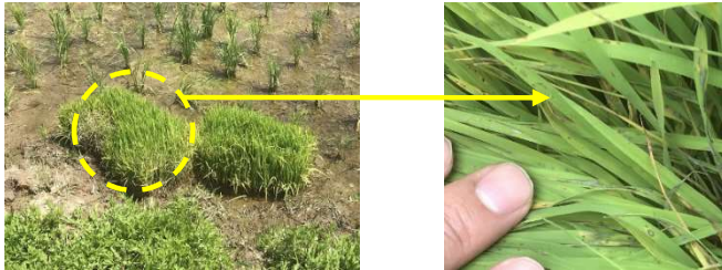
図6 取置苗での葉いもち発生

ウ 葉いもち予防水面施用粒剤を施用する前や箱施用剤を使用した場合でも、圃場をよく観察して葉いもちの発生が見られた場合には、直ちに茎葉散布を行います。