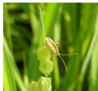
図8 アカスジカスミカメ成虫