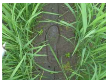
図3 中干し程度（軽く踏んで足跡がつく）