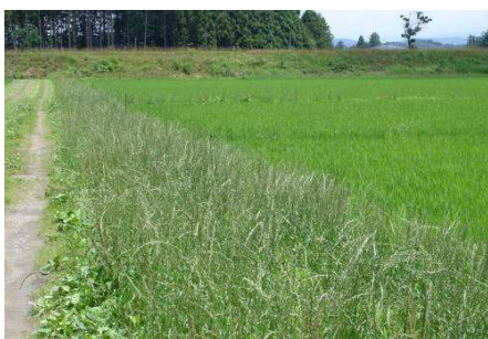
図7 畦畔に群生するイタリアンライグラス （斑点米カメムシの増殖原となる）

エ 草刈り後10日間程度は雑草の発生を抑制できますが、その後も、イネ科植物（イタリアンライグラス、スズメノカタビラ等）を出穂させないように管理します。