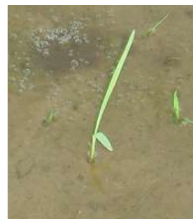
図5 ノビエ2葉期頃の個体